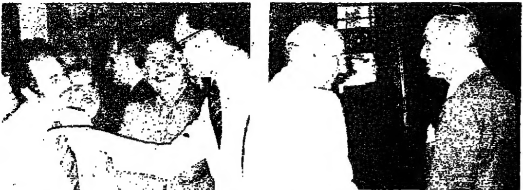
حديث جدي بين الشيخ بيار الجبيل والسفير الفرنسي (حديث صاحبك بين الرئيس الحص والسفير الفرنسي)

في عتبة سفارتنا الوطني يشكلان رمزا صادقا للعلاقات الثابتة التي تربط بين لبنان وفرنسا